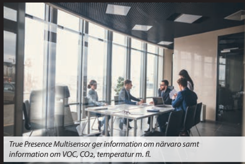
True Presence Multisensor ger information om närvaro samt information om VOC, CO 2 , temperatur m. fl.