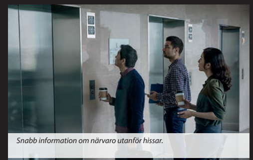
Snabb information om närvaro utanför hissar.