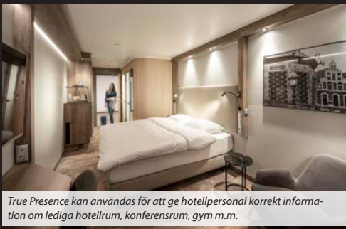
True Presence kan användas för att ge hotellpersonal korrekt information om lediga hotellrum, konferensrum, gym m.m.