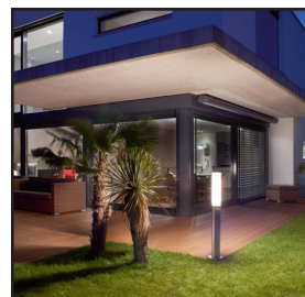
GL 60 monterad